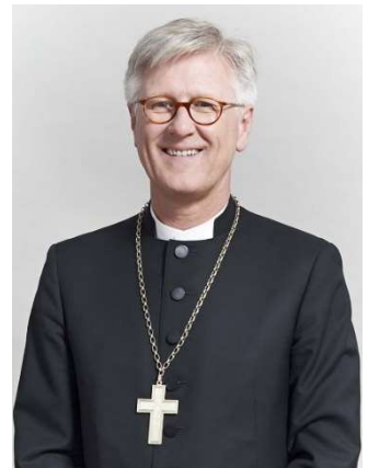
Dr. Heinrich Bedford-Strohm Landesbischof Tri Heinrich Bedford-Strohm Osavaltionpiispa