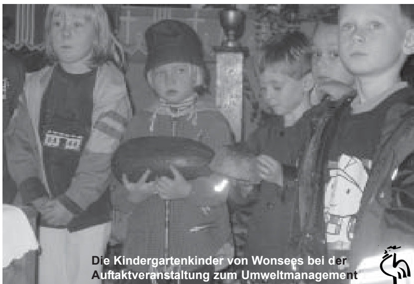
Die Kindergartenkinder von Wonsseß bei der Auftaktveranstaltung zum Umweltmanagement

In der Kirchengemeinde Oberunterberg gab es schon lange ein paar Leute, die sich für Umweltfragen interessierten und auch konkret etwas tun wollten. Sie erreichten, dass der Kirchenvorstand den Beschluss fasste, einen Umweltberater zu holen und mit ihm herauszufinden, was die Gemeinde zugunsten der Umwelt tun könnte. Ideen waren