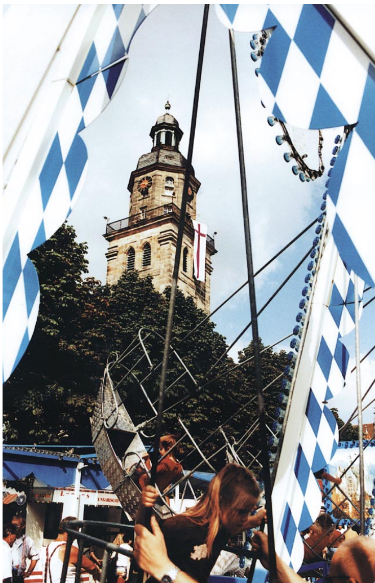
► Kirche mitten im Leben: Kirchweih im mittelfränkischen Altdorf. Ein prämiertes Bild des Fotowettbewerbs „Kirche vor Ort“.

Gegen Zentralismus wandte sich der Vorsitzende des synodalen