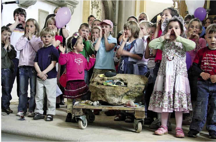
► Kirche der Zukunft: Eines der prämierten Bilder beim Fotowettbewerb „Kirche vor Ort“.

Die Nähe zu den Menschen müsse ein Kennzeichen der Kirche bleiben, folgerte die Synode aus dem 30-seitigen Auswertungsbericht,