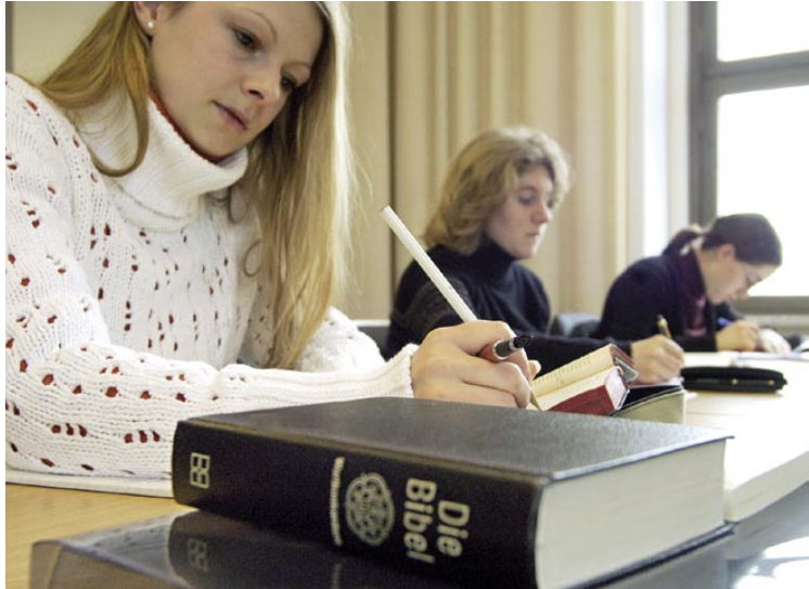
► Kürzer studieren und trotzdem weiterhin praxisnah: Die Synode beschließt Praktika für Theologiestudierende.