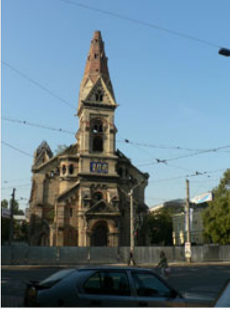
Die Ruine von St. Paul wird jetzt zum Deutschen Zentrum wiederaufgebaut.