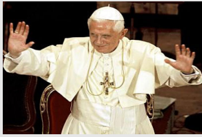
Vorlesung in der Uni Regensburg