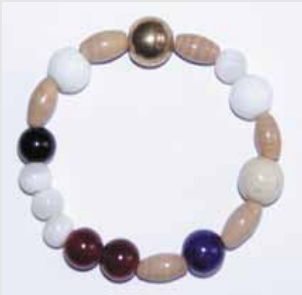
Die Perlen des Glaubens