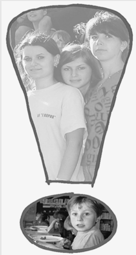
Aktion Fastenopfer 2006 Hoffnung für Osteuropa