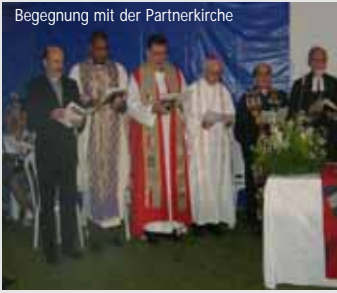
Begegnung mit der Partnerkirche