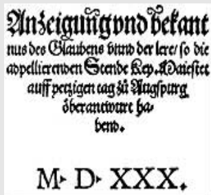
Original-Titelseite der ersten gedruckten Ausgabe der Confessio Augustana