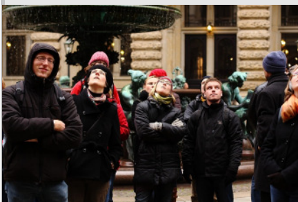
Stadtführung in Hamburg