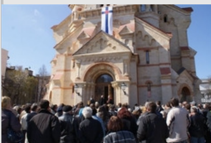
Einweihungsfeier von St. Paul in Odessa

Ein Wochenende lang stand die kleine evangelische Gemeinde in Odessa im Mittelpunkt des öffentlichen Interesses. Die ganze Stadt feierte die Auferstehung aus Ruinen für eines der Wahrzeichen der Hafenmetropole.