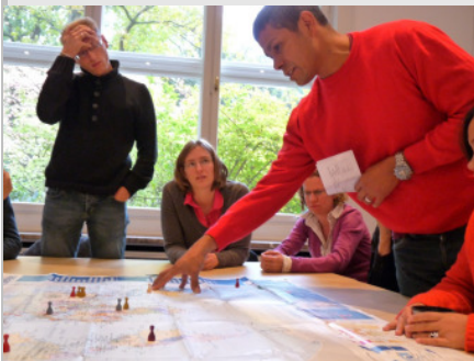
Brot für die Welt

Auf dem Gebetsteppich einer Moschee sitzend lernten wir, dass es muslimischen Fundamentalismus aus Sicht des Islam nicht gibt. Fundamentalismus ist in erster Linie ein christlicher Begriff, der nicht ohne weiteres auf den Islam übertragen werden kann. – Ein Perspektivwechsel für das bisherige Denken in Mustern. Zudem diskutierten wir über das Konzept von Partnerschaften und erkannten, dass Globalisierung immer zurückwirkt auf das Lokale. Ihre Folgen werden gerade hier sichtbar, das gilt auch für den Bereich der Religion (Globalisierung des Religiösen).