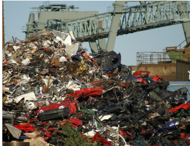
Schrottverladung im Hafen

Nicht jeder will komplett auf Fleisch verzichten. Aber Nutztiere sind Mitgeschöpfe und verdienen ein würdiges Leben. Der Öko-Landbau garantiert eine artgerechte Tierhaltung, zum Beispiel genügend Auslauf und Liegeflächen für Rinder.