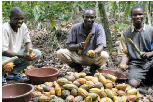
Kakao-Bauern, Partner des fairen Handels.

Einige der ärmsten Länder des Südens trifft der Klimawandel heute schon sehr hart. Aber sie haben wenig Mittel, um die Folgen des Klimawandels zu bekämpfen. „Fairer“ Handel sichert den Menschen im Süden ein Einkommen, mit dem sie ihre Lebensgrundlagen bewahren können. So bauen wir gemeinsam, Menschen im Süden und im Norden, an der grünen Zukunft unseres Planeten.