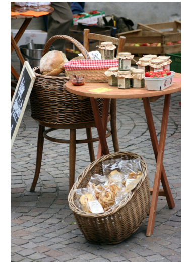
Wochenmarkt: ein guter Ort zum regional einkaufen

Personen- und Güterverkehr tragen zu einem erheblichen Teil zur CO 2 -Belastung unseres Planeten bei. Wenn Sie regionale Produkte wählen, sichern Sie daher auch unsere grüne Zukunft!