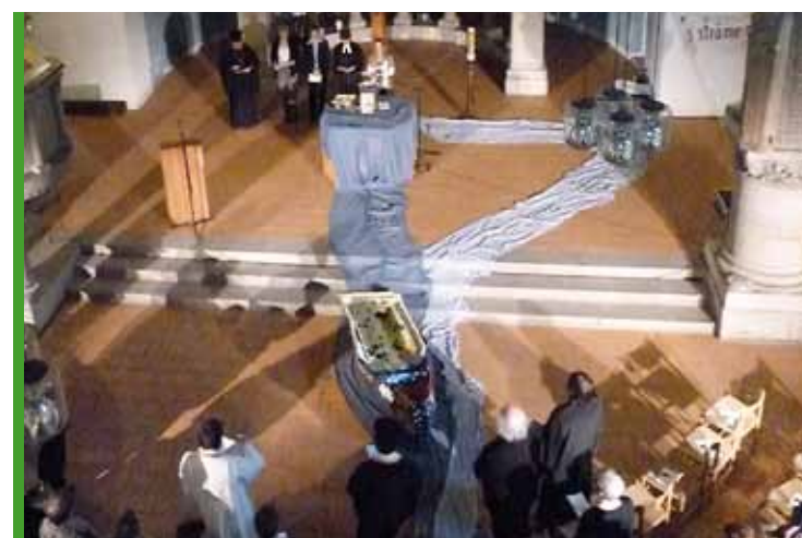
Segensgottesdienst für die Donau-Friedenswelle beim 2. Ökumenischen Kirchentag in München

lädt ein ökumenisches Team zu einer ganztagigen Veranstaltung, die mit einem Gottesdienst abschließt, ins Kloster Niederaltaich ein. Die bayerische Justizministerin Dr. Beate Merk wird in einem Impulsreferat die politische Sicht auf das Thema Gewaltüberwindung darstellen. Nach einem ökumenischen Dekade-Rückblick münden Workshops zu den Schwerpunktthemen Kinder und Jugendliche, Mediation sowie Menschenhandel in konkrete, an